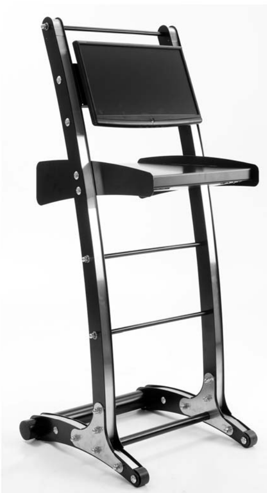
Borne Interactive BK100